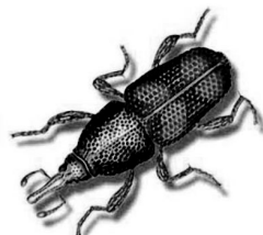
Wołek ryżowiec Sitophilus oryzae