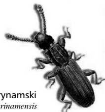
Spichrzek surynameński Oryzaephilus surinamensis