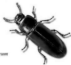
Trojszyk ulec Tribolium castaneum