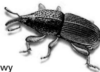
Wołek zbożowy Sitophilus granarius