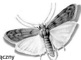
Mklik mączny Ephesia kuehniella